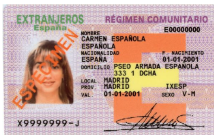
Spansk uppehållsrelaterad handling, endast giltig i Spanien.

Med jämna mellanrum ser vi också de spanska uppehållskorten märkta "Extranjeros" (Utlänningar). De tillkom efter en lagändring 2009 i syfte att rensa upp i skuggsamhället. Genom dessa uppehållsrelaterade handlingar gavs papperslösa en möjlighet att registrera sig för att få ökade sociala rättigheter och möjlighet till en vit, skattad inkomst. De utfärdas i olika färger och för olika kategorier (exempelvis arbete, asylsökande eller studier), alla märkta "Extranjeros". Värt att hålla i minnet är att de är giltiga endast i Spanien, inte i resten av EU.