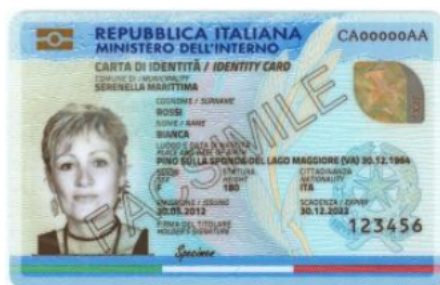
ID-kort utfärdat för italiensk medborgare.

Vi har noterat en svag ökning av olika EU-handlingar som ger sken av att individen har rätt att vistas och arbeta i Sverige. Vanligast är de italienska ID-korten som utfärdas till icke-medborgare, de är förvillande lika de som utfärdas till italienska medborgare. Det enda som skiljer dem åt är givetvis uppgift om medborgarskap samt texten "NON VALIDA PER L'ESPATRIO" (ej giltigt för resor utomlands).