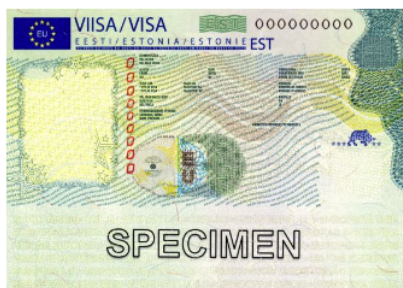
Exempel på visering utfärdad av Estland.

Visa D, en visering som klistras fast i passet har också seglat upp under 2022: