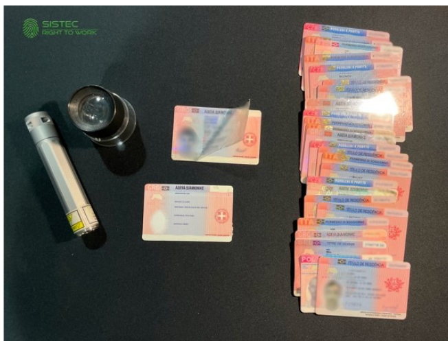
Ett urval av alla falska arbets- och uppehållstillstånd som vi avslöjat under 2022.

Den trend vi sett under hela det gångna året är att man använder sin riktiga identitet (passet) men uppvisar falskt EU-tillstånd, inte sällan med status "Varaktigt bosatt inom EU". De falska pass och nationella ID-kort vi upptäckt är uteslutande uppbyggda på falska identiteter. Några av de falska identiteter vi avslöjat har även registrerade samordningsnummer, vilket tyder på att man försöker bygga upp en ny legend i Sverige. Orsaken till användandet av falska identiteter är inte sällan kopplat till kriminalitet, spionage eller terrorism.